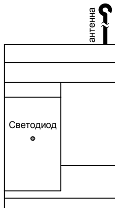
Рис. 1. Внешний вид передатчика

Габаритные размеры: 75 x 120 x 32 мм (без антенны)